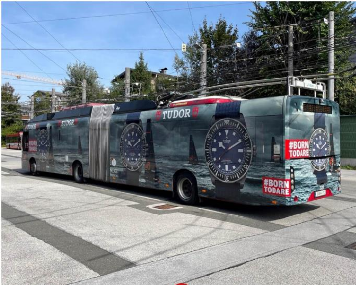
Kunde: Uhren & Juwelen Siegl

Der Salzburger Flughafen setzt auf dem Jumbo Heck auf UmsteigAIR uns wird von den Wählern für die guten Aussichten mit Silber bei der Progress-Out-of-Home-Trophy 2023 belohnt. 2. Platz für die von der Bounty Communication Group designte Transport Media-Kampagne.