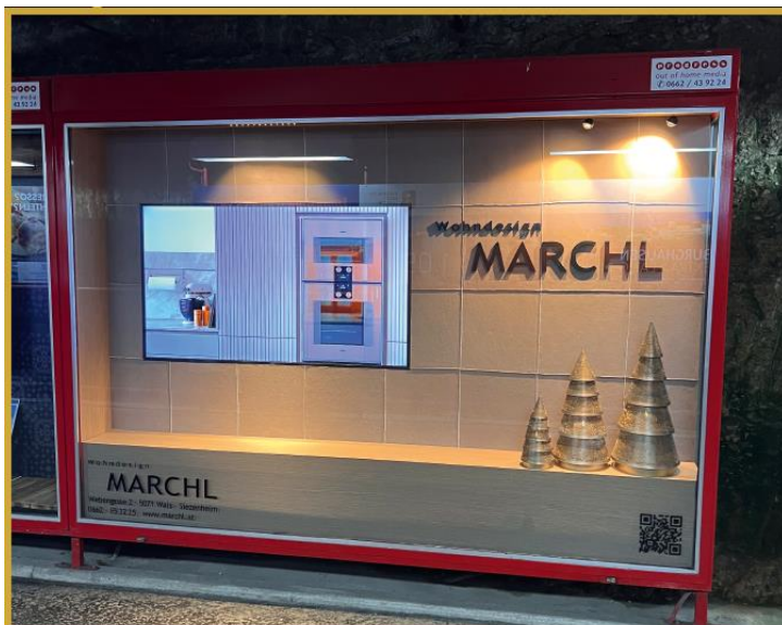
Kunde: Wohndesign MARCHL