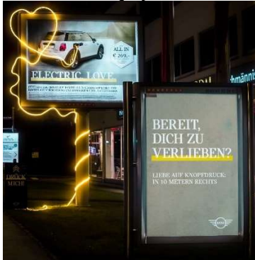
Kunde: BMW Austria Agentur: CREATIVE TACTICS

Mit Electric Love auf Knopfdruck, einem Buzzer neben dem Rolling Board und jeder Menge Überraschungen und Innovation, gibt es keine Frage, dass Mini der Gewinner der Progress-Out-of-Home-Trophy 2021 in der Kategorie Innovative & Ambient Media ist.