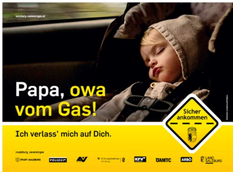
Kunde: Land Salzburg Agentur: ikp Salzburg

Mit einer extrem starken Message, die an Signalwirkung kaum zu übertreffen ist, gewinnt das Land Salzburg die Progress-Out-of-Home-Trophy 2021 in der Kategorie Rolling Board absolut verdient.