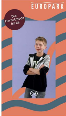
Kunde: EUROPARK Agentur: David Wöckinger / Christian Steinwender

Mit einer beircenden und gleichzeitig verführerischen Kampagne, die uns auf den digitalen City Lights begeistert, geht der EUROPARK ganz klar als Sieger der Progress-Out-of-Home-Trophy in der Kategorie Digital OOH hervor.