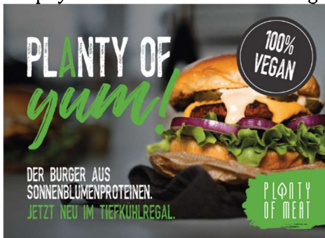
Kunde: Planty of Meat Agentur: All new Arts

Ein super ansprechender veganer Burger, der uns am Rolling Board nicht nur planty of yum beschert, sondern auch noch easy zuzubereiten ist, verdient klar die Progress-Out-of-Home-Trophy 2021 in Bronze in der Kategorie Rolling Board.