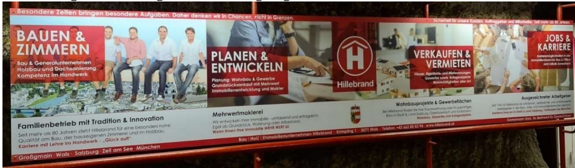
Kunde: Hillebrand Agentur: BEYONDMIND Kreativkonzepte

Eine meterlange Werbetafel mit der perfekten Übersicht über das gesamte Leistungsspektrum des Familienunternehmens Hillebrand mit gleichzeitigem HR-Aufruf hat in den Altstadtgaragen überzeugt. Verdientes Gold bei der Progress-Out-of-Home-Trophy 2021 für die Dauerwerbung in der Kategorie Werbung in der Altstadtgarage.