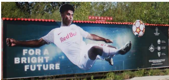
Kunde: FC Red Bull Salzburg Agentur: CREATIVE TACTICS

So geht Formatsprengung am Plakat, Sonderwerbeformat vom Feinsten. Ein 48/1-Bogen-Plakat mit herausstehendem Kopf von Starstürmer Adeyemi und herausragendem Volltreffer des Balls, verdient ganz klar Silber bei der Progress-Out-of-Home-Trophy 2021 in der Kategorie Innovative & Ambient Media.