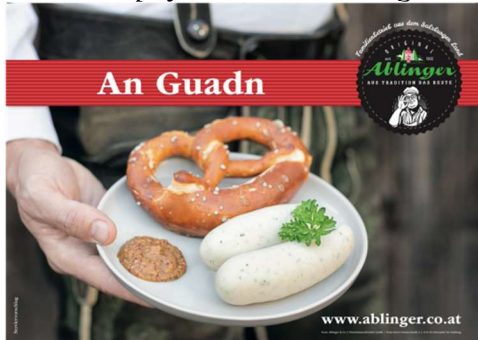
Kunde: Ablinger Agentur: WMW Werbeagentur

Die klare Zielgruppenansprache von Ablinger, am dafür absolut idealen Medium Plakat, lässt uns das Wasser im Mund zusammenlaufen, klare Entscheidung für Gold bei der Progress-Out-of-Home-Trophy 2021 in der Kategorie Plakat.