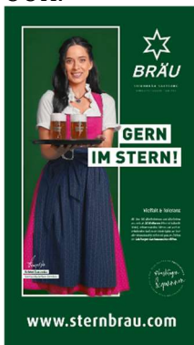
Kunde: Sternbräu Agentur: buerobinder e.U.

Super Kombination aus Branding und Claim im klaren Design, optimal für Digitale Screens aufbereitet, verdient Bronze in der Progress-Out-of-Home-Trophy 2021 in der Kategorie Digital OOH.