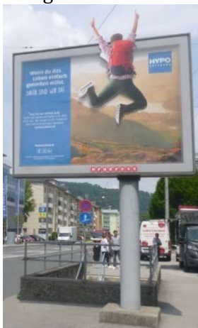
Kunde: HYPO Salzburg

Maximaler Effekt durch emotionale Formatsprengung, klares Branding und ein wunderbar ansprechendes Sujet verdienen Bronze bei der Progress-Out-of-Home-Trophy 2021 in der Kategorie Innovative & Ambient Media.