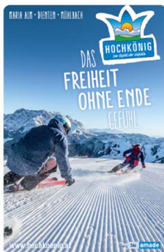
Kunde: Aberg-Hinterthal Bergbahnen Agentur: Manuela Racz - ra[c]z fatz grafik + mehr

2. Platz: Aberg-Hinterthal Bergbahnen – „Das Freiheit ohne Ende Gefühl“ Out of Home-Freiheit ohne Ende der Skiregion Hochkönig ist der Gipfel der Gefühle am City Light und verdient sich damit klar die Progress-Out-of-Home-Trophy in der Kategorie City Light in Silber.