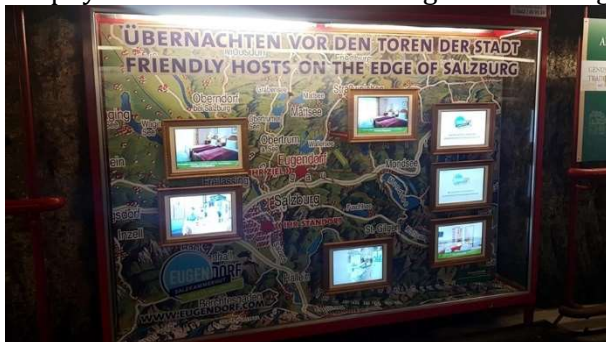
Kunde: Tourismusverband Eugendorf

Eine absolut optimale Kombination aus frequenzstarker Zielgruppenansprache an Touristen und gleichzeitiges Aufmerksam machen an die Salzburger Bevölkerung vom Tourismusverband Eugendorf in der Vitrine der Salzburger Altstadtgaragen verdient die Progress-Out-of-Home-Trophy 2021 in Silber in der Kategorie Werbung in der Altstadtgarage.