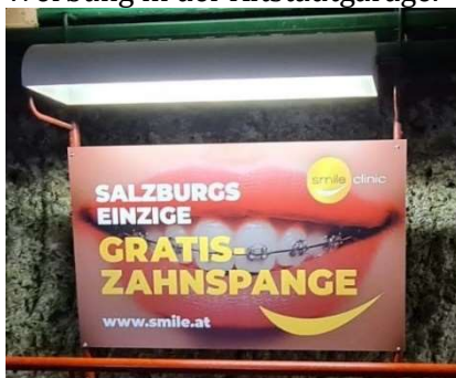
Kunde: Smile Clinic Agentur: Communication MINTMIND

Einladend und mit Ironie präsentiert sich die Smile Clinic Zahnklinik am Dauerwerbeträger in den Salzburger Altstadtgaragen. Ein für so manchen unangenehmes Thema mit einem Lächeln aufbereitet, verdient die Progress-Out-of-Home-Trophy 2021 in Bronze in der Kategorie Werbung in der Altstadtgarage.