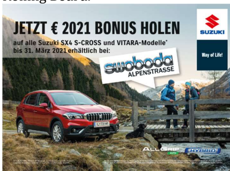
Kunde: SUZUKI AUSTRIA Agentur: awp – Agentur Warter & Partner

Mit clever gewählten Standorten, klarer Präsenz und einem unübersehbaren Angebot holt sich das Autohaus Swoboda die Progress-Out-of-Home-Trophy 2021 in Silber in der Kategorie Rolling Board.