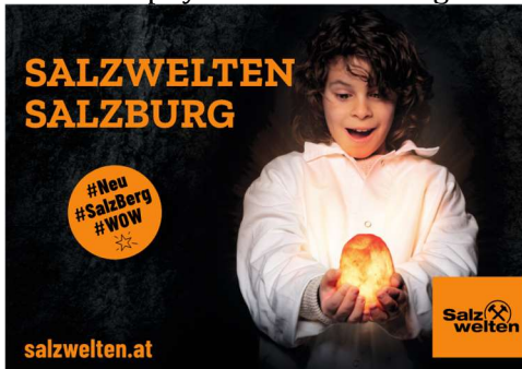
Kunde: Salzwelten Agentur: c. i. Werbeagentur

Die Freude steht einem, am Plakat der Salzburger Salzwelten, ins Gesicht geschrieben, perfekte Kombination aus Emotion und Werbeträger, daher verdientes Silber bei der Progress-Out-of-Home-Trophy 2021 in der Kategorie Plakat.